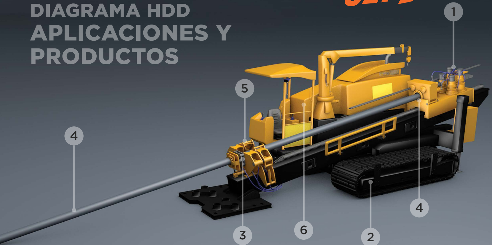
DIAGRAMA HDD APLICACIONES Y PRODUCTOS